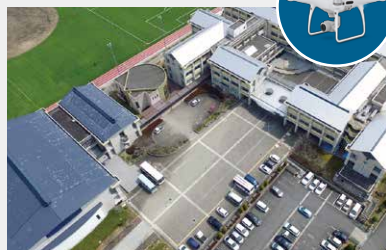
奈良県立五條高等学校創立120周年記念