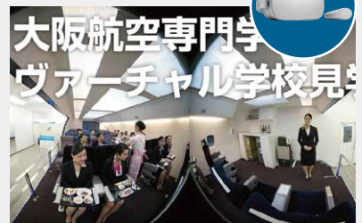
大阪航空専門学校 ヴァーチャル学校見学